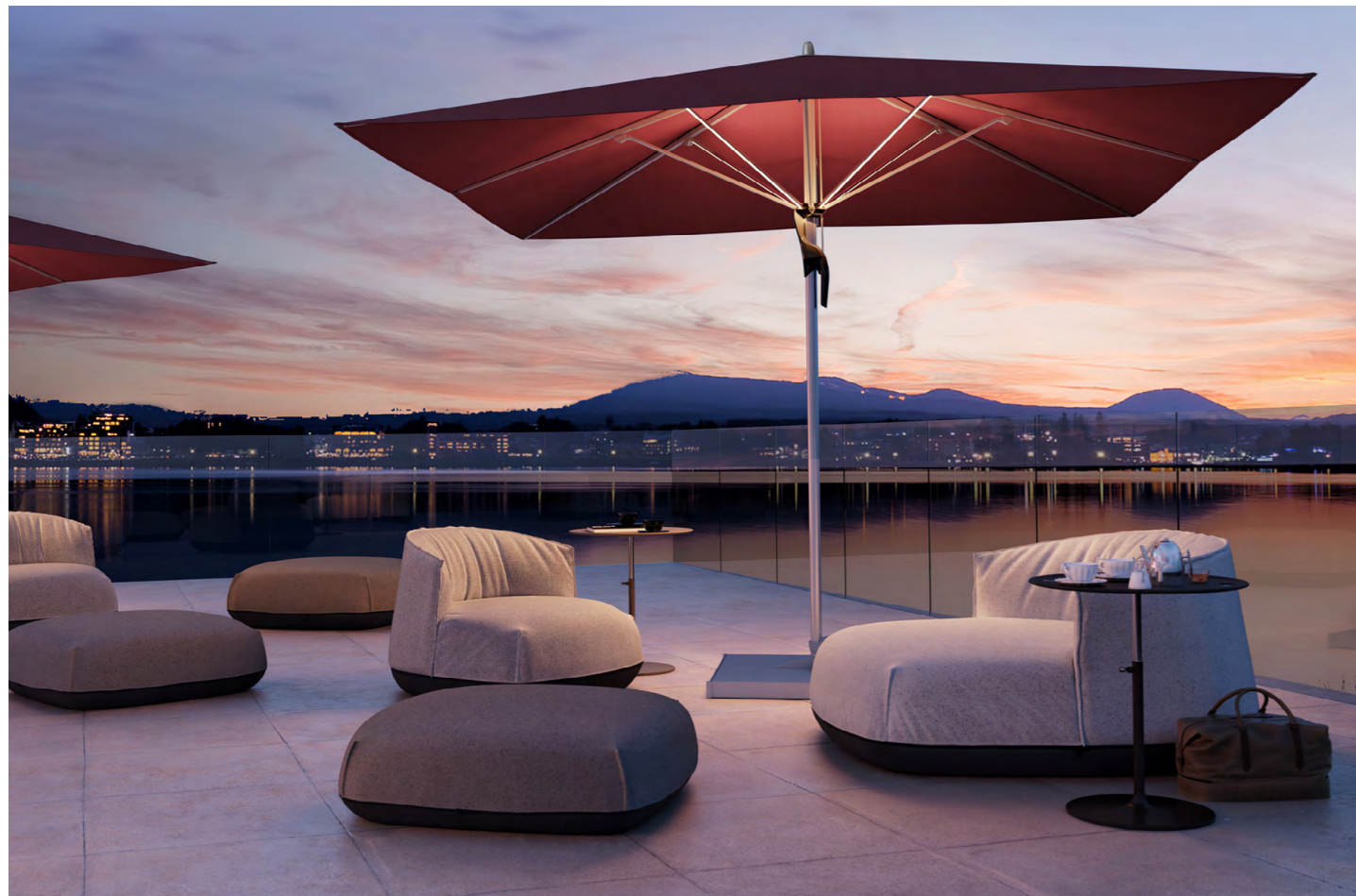
Sonnenschirm ‚Fortello LED‘ von Glatz.