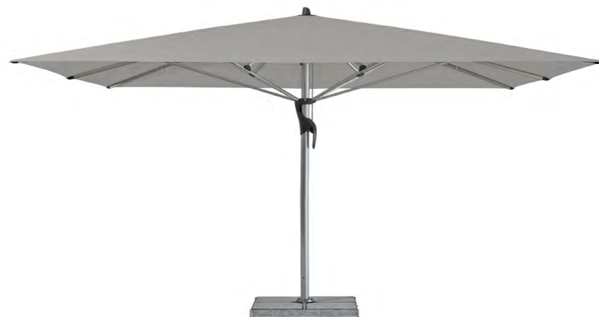
Sonnenschirm ‚Fortello LED‘ von Glatz.

Erst die richtige Beschattung macht den Garten zum Paradies. Die Auswahl ist vielfältig und soll Outdoor-Möbel unterstreichen und nicht übertrumpfen. Im Jahr 2023 brillieren smarte Modelle mit eleganter Ästhetik. Schirme mit integrierter Leuchtkraft verlängern das Beisammensein bis in die späten Abendstunden. Auch an die Stoffe werden immer höhere Anforderungen gestellt. Sie sollen hartnäckige UV-Strahlen abwehren, vor Wind und Regen schützen, langlebig sein und trotzdem ein ästhetisches Bild vermitteln. Zudem sollen kleine und grosse Schirme unkompliziert und möglichst ohne Kraftaufwand geöffnet und wieder geschlossen werden können.