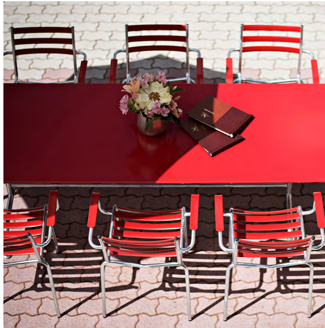
Sitzkombination ‚Bättig‘ von Manufakt.

Modern, pflegeleicht und strapazierfähig sind Stühle, Bänke und Tische aus der Gartenmöbelkollektion von Bättig. Die wetterbeständigen Möbel sind bekannt für ihre Langlebigkeit. Die bewährten Klassiker zeichnen sich durch ein ansprechendes Design und hohe Funktionalität aus. Alle Modelle sind in diversen RAL-Farben erhältlich.