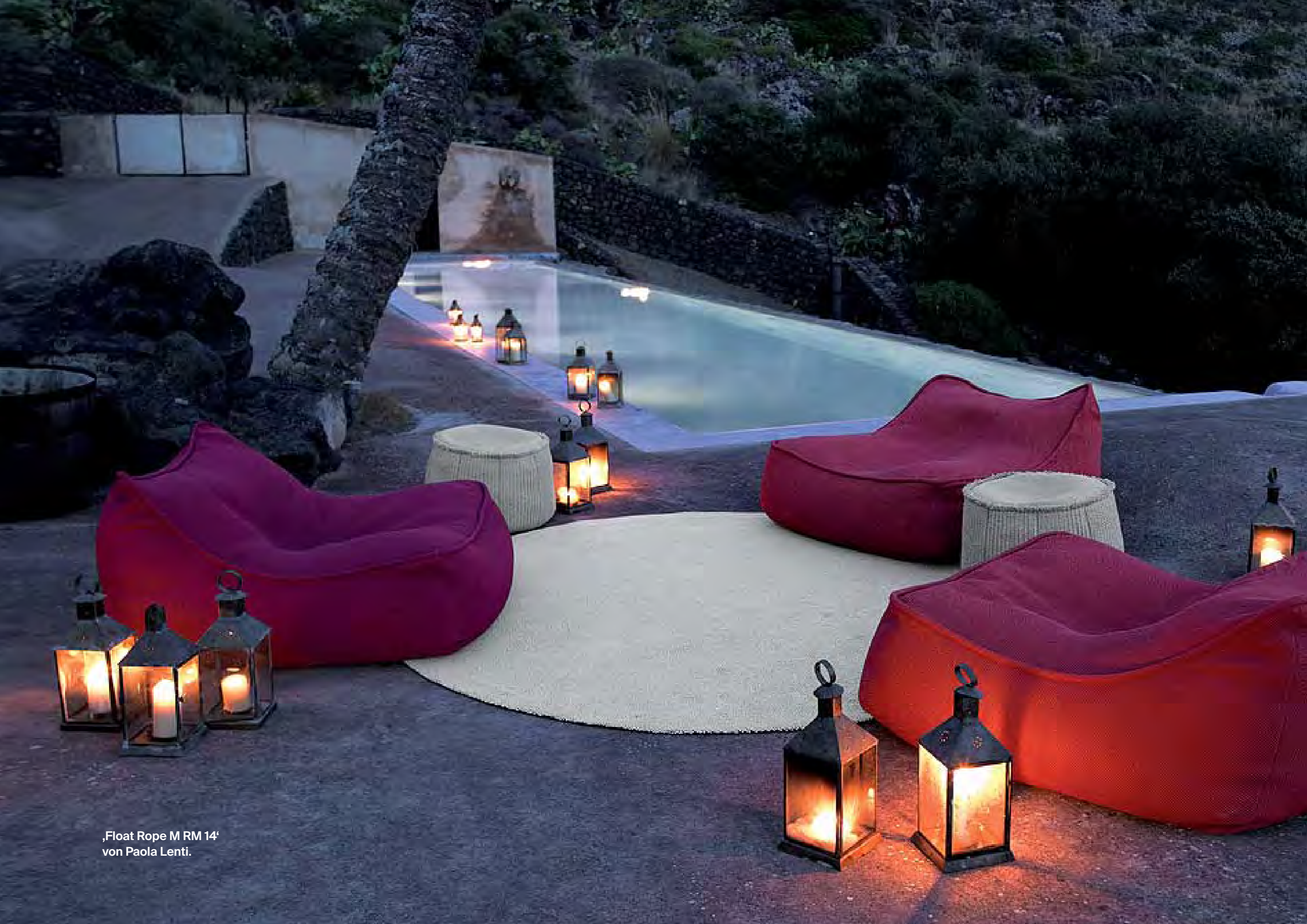
,Float Rope M RM 14' von Paola Lenti.