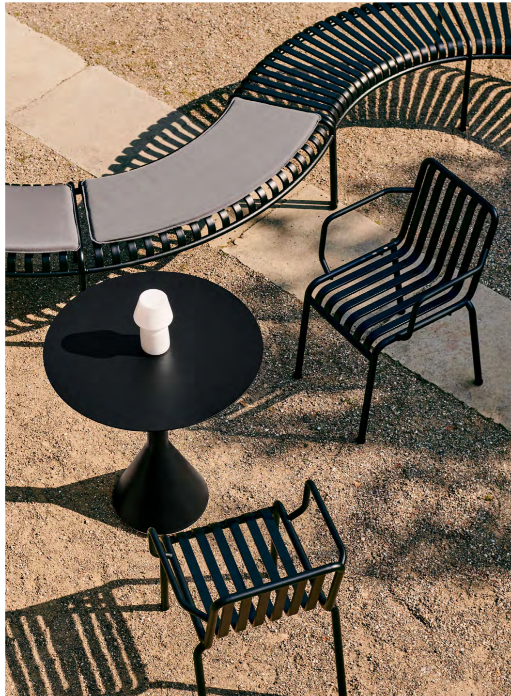
Sitzkombination ‚Palissade‘ von HAY.

Palissade wurde von den französischen Brüdern Ronan und Erwan Bouroullec für HAY entworfen. Die Outdoor-Möbel bestehen aus pulverbeschichtetem oder feuerverzinktem Stahl. Die Palissade-Kollektion wird durch ein gemeinsames Prinzip der symmetrischen Geometrie vereint und ist so konzipiert, dass sie überall die gleiche visuelle Einfachheit und Kernstärke aufweist. Palissade ist in Farbe und Form so gestaltet, dass es sich mühelos in eine natürliche Landschaft oder eine urbane Umgebung einfügt. Die Kollektion eignet sich für eine Vielzahl von Bereichen: von Cafés und Restaurants bis hin zu Gärten, Terrassen und Balkonen.