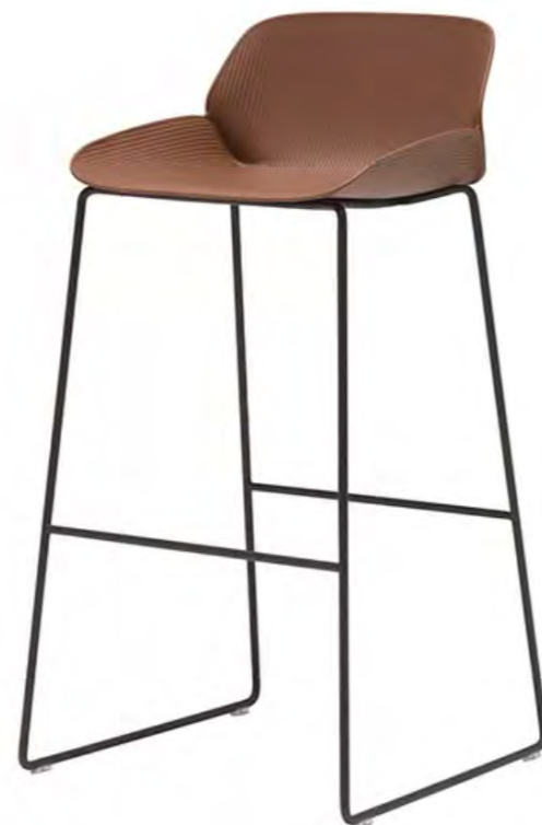
Hoher Hocker Modell Nr. BQ2893 von Andreu World. Mit 100% rezyklierter Eco-Thermopolymer-Schale.

In Europa werden nachhaltige Produkte immer wichtiger. Man möchte der Welt etwas Gutes tun und sich in einem Umfeld bewegen, das diese Werte teilt. Viele Produzenten sind nicht nur aus ideologischen, sondern auch aus wirtschaftlichen Gründen auf diesen Trend aufgestiegen. Für ihre Produkte verwenden sie nachhaltige Rohstoffe wie Holz, Bambus, Kork, Baumwolle oder auch neue Materialien, wie zum Beispiel Algen und rezykliertes Pet. Neben dem Hauptmaterial sollen auch Lacke und Lasuren schadstofffrei sein. Ein nachhaltiges Gartenmöbel ist aber vor allem langlebig und zeitlos, damit es viele Jahre eingesetzt werden kann.