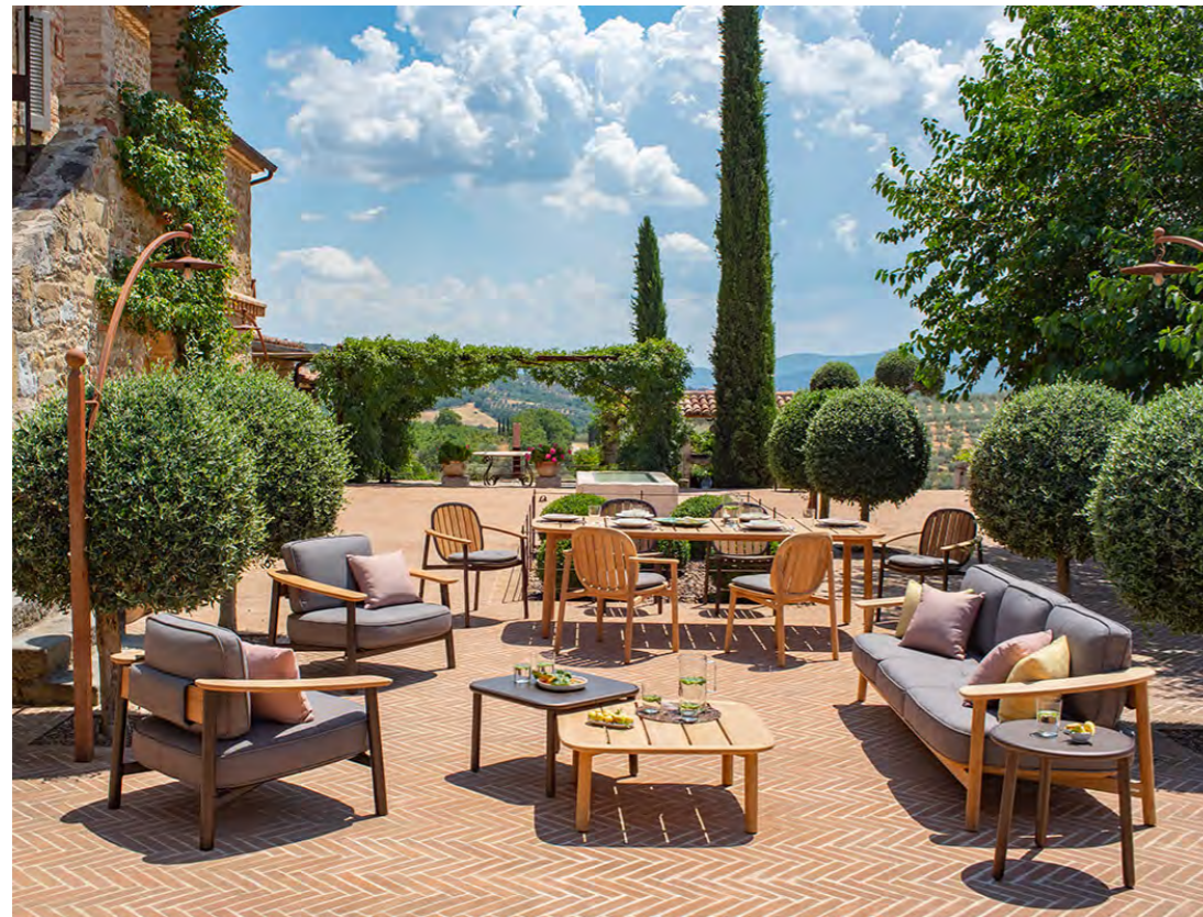
‚Twins Kollektion‘ von EMU.

Die Twins-Kollektion von EMU umfasst zwei Zwillingversionen: eine Kollektion komplett aus Teakholz gefertigt und eine andere, in der ein interessanter Materialmix bestehend aus Teakholz und Aluminium gewählt wurde. ‚Twins‘ ist eine Kollektion aus Sesseln, Tischen und Sofas, welche die Grenze zwischen Innen und Aussen aufhebt. Ihre Einzigartigkeit lässt sich unterstreichen, indem man die beiden Versionen untereinander kombiniert, oder mit anderen Möbeln aus der EMU-Kollektion verbindet.