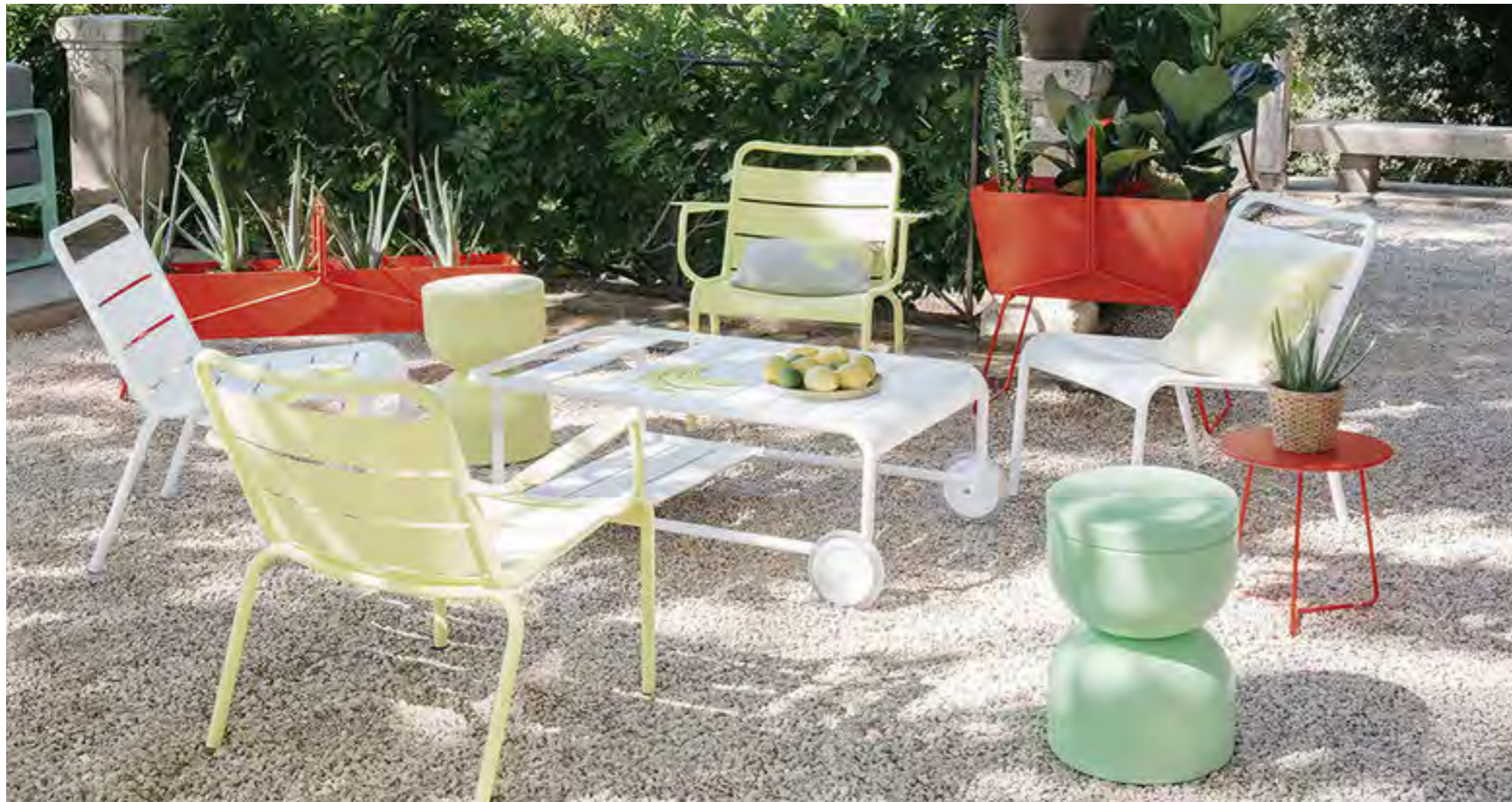
Fermob ‚Luxembourg‘ Lounge Sessel.

Die Einrichtung spiegelt unsere aktuellen Bedürfnisse wider. Gerade in unsicheren Zeiten suchen wir Geborgenheit und Orte, die wir genießen können. Angesagt sind Möbel, auf denen es sich Nutzer:innen gemütlich machen können. Die perfekte Gartenlandschaft bietet im Jahr 2023 gemütliche Rückzugsmöglichkeiten innerhalb von Garten-Nischen. Sie besitzt unterschiedliche Möbelkombinationen aus komfortablen Liegen und Loungen über einladende Tische und Stühle bis hin zur passenden Beleuchtung. Waren es im Jahr 2022 vor allem warme Farbkombinationen, wird es im Frühling/Sommer 2023 fröhlich und bunt.