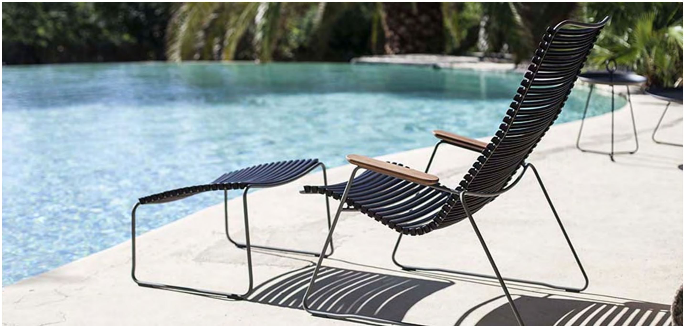
Houe ‚Click‘ Lounge Chair.

Im kommenden Sommer möchten Nutzende nicht verzichten. Komfort und Stabilität werden auch von Sitzmöbeln erwartet. Der Lounge Chair von Houe bietet beides: den Sitzkomfort eines Schaukelstuhls und die Stabilität einer am Boden stehenden Sitzgelegenheit. Das Gestell aus pulverbeschichtetem Aluminium ist wetterbeständig und damit perfekt für die Platzierung am Pool geeignet. Der Wunsch nach Abwechslung wird ausnahmslos erfüllt. Denn die Sitz- und Rückenfläche des Loungestuhls bestehen aus abnehmbaren Kunststofflamellen, die durch andersfarbige Lamellen austauschbar sind. Damit kann das Aussehen des Sessels nach Belieben verändert werden.