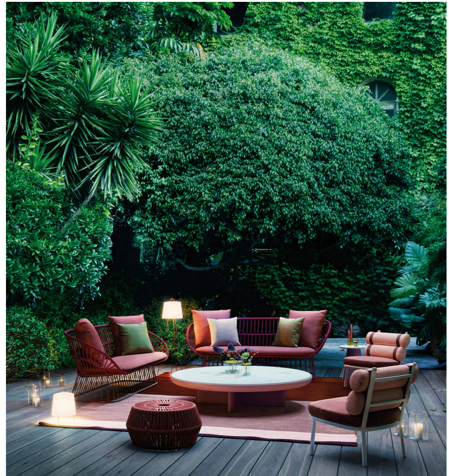
Kettal Lounge ‚Cala‘ mit Hocker ‚Bela Rope‘.